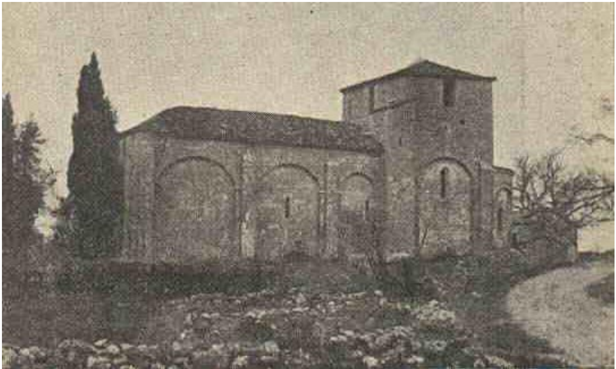
Vue extérieure de l'église de Saint-Constant

A l'origine, cette église fut une chapelle créé sous le vocable de Saint-Gervais et Saint-Constant par les ordres du seigneur du lieu et probablement à la même date que sa voisine, l'église de Saint-Prie ( Saint-Projet ), qui remonte à 666, sous le mérovingien Childeric II .