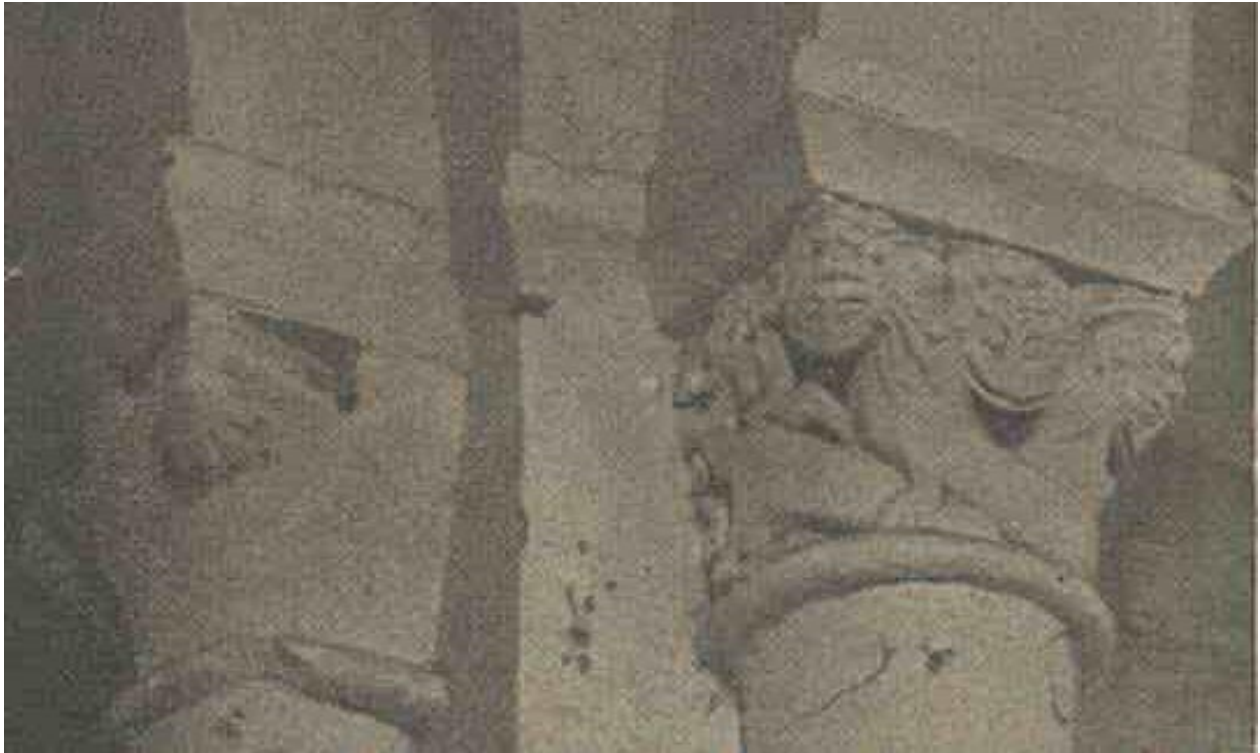
Chapiteaux de l'église Saint-Constant

Du côté sud de la nef, une ouverture dans le mur donne accès au clocher par un escalier en pierre qui se développe en spirale dans un contrefort extérieur qui, comme les trois autres, se termine en angle aigu et en biseau. Le clocheton de base quadrangulaire est formé d'un arceau en plein cintre, percé d'une petite fenêtre du même style et le tout recouvert en tuile courbes.