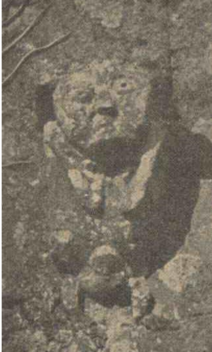
Modillon de l'église de Saint-Constant

L'ordonnance royale du 28 juin 1845 établissait que Saint-Constant serait annexe à la commune de Saint-Projet , l'église fut dès lors que peu fréquentée; aussi la fabrique de Bunzac obtint-elle le droit de la vendre.