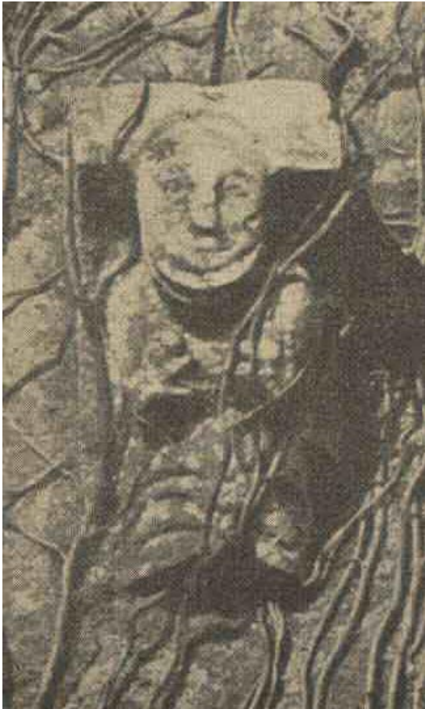
Modillon de l'église de Saint-Constant

La paroisse de Saint-Constant formait une unité administrative et comptait, en 1801, 161 habitants répartis dans les villages de Larecas , Chez-Raizoux , les Lignons , Puyvidal et les Ombrailles . Par le décret impérial du 27 mars 1805, la paroisse fut supprimée et annexée à Bunzac où le desservant fut envoyé.